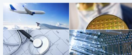
TABLEAU DES FLUX DE TRESORERIE CONSOLIDES